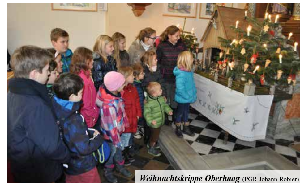
Weihnachtskrippe Oberhaag (PGR Johann Robier)